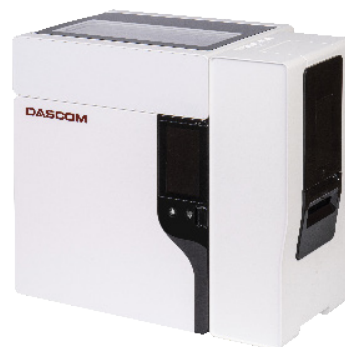
Modèle à double bac

DASCOM Europe GmbH 7, Impasse de la Chanée | 77410 Annet Sur Marne | FRANCE Tel.: +33 1 85 42 24 00 info.fr@dascom.com | www.dascom.fr